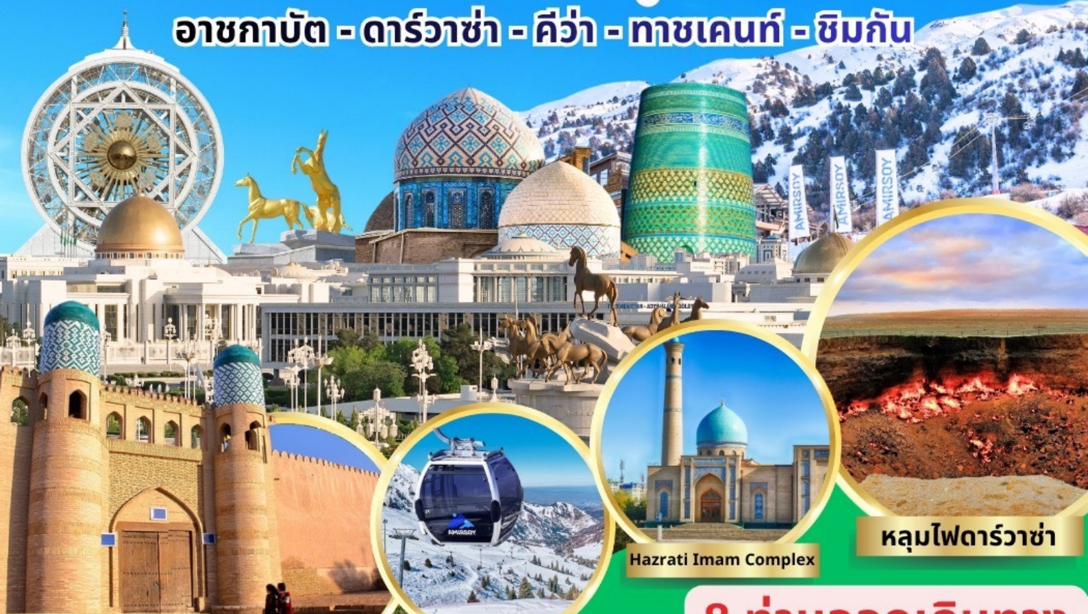
ป้อมคูน่า อาร์ค

อาชกาบัต - ดาร์วาซ่า - คีว่า - ทาชเคนท์ - ซิมกัน