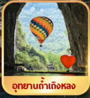
อุทยานถ้ำเหิงหลง