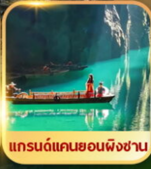
แกรนด์แคนยอนผิงชาน