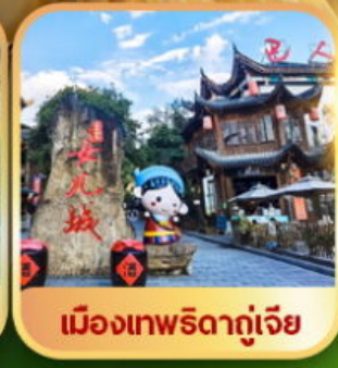
เมืองเทพริดาตุ๋เจีย