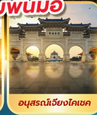
อนุสรณ์เจียงไคเชค