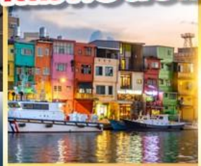
ท่าเรือประมงเจิ้งปิน