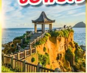
เกาะเหอฝิง

พักย่านซีเหมินติง 2 คืน ขอพรเจ้าแม่กวนอิมพันมือ