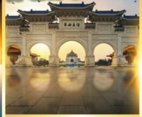
อนุสรณ์เจียงไคเชก