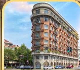
อาคารอู่คิง