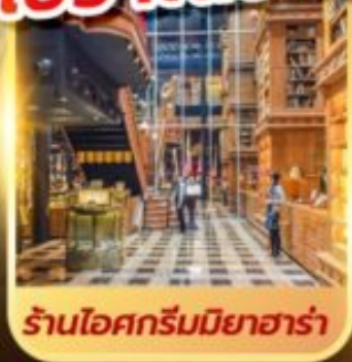
ร้านไอศกรีมมียาฮาร์