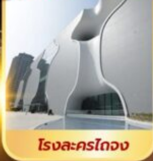
โรงละครไทจง