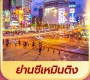
ย่านซีเหมินต้ง