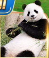
สวนสัตว์ฉงชิ่ง