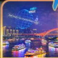
ล่องเรือแม่น้ำแยงซีเกียง