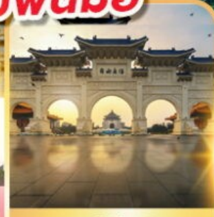
อนุสรณ์เจียงไคเชก