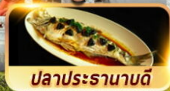
ปลาประรานาบดี