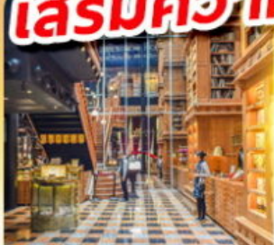
ร้านไอศกรีมมียาฮ่า