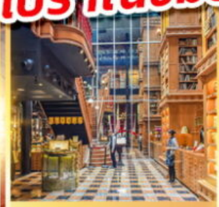
ร้านไอศกรีมมียาฮาร์