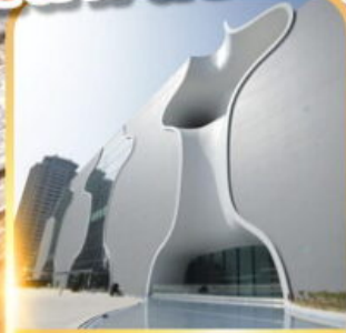
โรงละครโดง