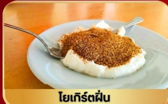
โยเกิร์ตผัสดอง