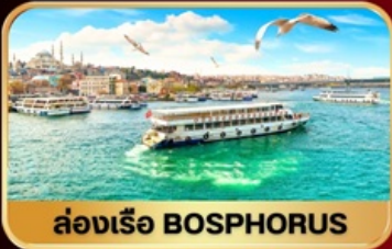
ล่องเรือ BOSPHORUS