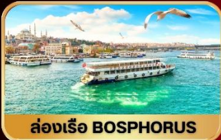
ล่องเรือ BOSPHORUS