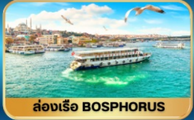
ล่องเรือ BOSPHORUS