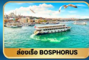
ล่องเรือ BOSPHORUS

น้ำหนักกระเป๋า 30 กิโล รวมประกันการเดินทาง พักโรงแรม 4 ดาว อาหาร 17 มื้อ