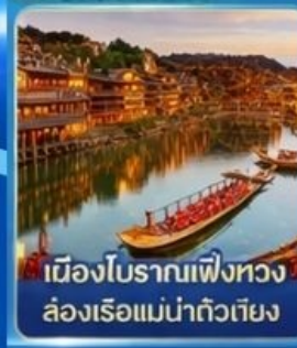
เมืองโบราณเฟิ่งหวง ล่องเรือแม่น้ำถั่วเจียง