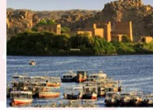
วิหารฟิเล

16.25 น. ออกเดินทางสู่กรุงไคโร สายการบิน Egypt Airlines เที่ยวบิน MS295