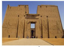
วิหารเอ็ดฟู