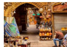
ตลาดخانเอลคาลีสี่

20.50 น. ออกเดินทางสู่อิสตันบูล เที่ยวบิน TK695