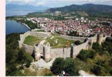
St. John at Kaneo Church บ่อมปราการซามูเอล

** พักที่ Hotel Holiday Inn 4* หรือเทียบเท่า **