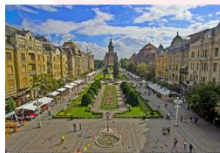
เมืองซีบีอู