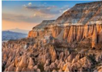
เมืองคัปปาโดเกีย

** พักที่ Dedeli Cave Hotel 5* หรือเทียบเท่า **