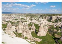
หุบเขาเดเฟเรนท์

** พักที่ Dedeli Cave Hotel 5* หรือเทียบเท่า **