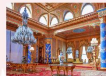
Beylerbeyi Palace ล่องเรือช่องแคบบอสฟอรัส