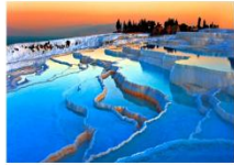
เมืองปามุคคาเล่

** พักที่ Richmond Thermal Hotel 5* หรือเทียบเท่า **