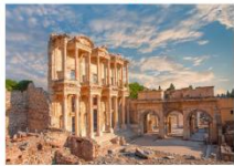
เมืองเอเฟซุส