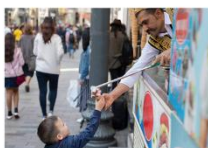
ไอศกรีม Maraş ชมพระอาทิตย์ตกดิน ณ ภูเขาเนมรุต