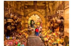
ตลาดขานเอลคาลิลี

19.50 น. เดินทางสู่ท่าอากาศยาน QUEEN ALIA ประเทศจอร์แดน เที่ยวบินที่ RJ 506