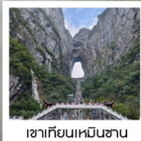
เขาคิยันเหมินชาน

ฉลองเที่ยวบินปฐมฤกษ์ เก็บครบทุกไฮไลต์!! วันที่ 10 พฤษภาคม 2569 กรุงเทพฯ - อางซา (จางเจียเจีย)