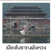
เมืองโบราณฟังหวง