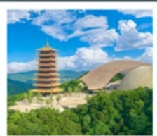
ภูเขาหนิวไ่ส่วซาน

อุทยานทะเลสาบไท่หู (รวมล่องเรือ) ถนนคนเดินซานตง • วัดจีหมิง ถนนอุ้งงูต้าเต้า • ห้างสรรพสินค้าต๋อจี้ ภูเขาหนิวไ่ส่วซาน (รวมรถกอล์ฟ) สะพานแม่น้ำแยงซีเกียงนานกิง • ทะเลสาบเซวียนอู่ หมู่บ้านเหนียนฮวาวัน • โรงงานเซรามิกเกาเอ้อด่าง เมืองโบราณเหย่าหู (รวมรถไฟเล็ก) • คุณซาน ถนนโบราณปาอิง • North Bund Green Land STARBUCKS RESERVE ROASTERY THE LOUIS • ถนนหวยไห่ (SONG MONT)