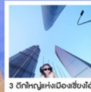
3 ตึกใหญ่แห่งเมืองเซี่ยงไฮ้