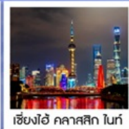
เซี่ยงไฮ้ คลาสสิก ไทท์