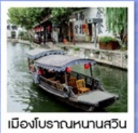
เมืองโบราณหนานสวิน