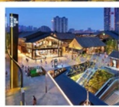
ถนนคนเดินไท่กู่หฺลี่