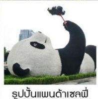
รูปปั้นแพนด้าเซลฟี่