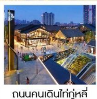
ถนนคนเดินไท่กุ่หฺลี่