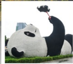
รูปปั้นแพนด้าเซลฟี่