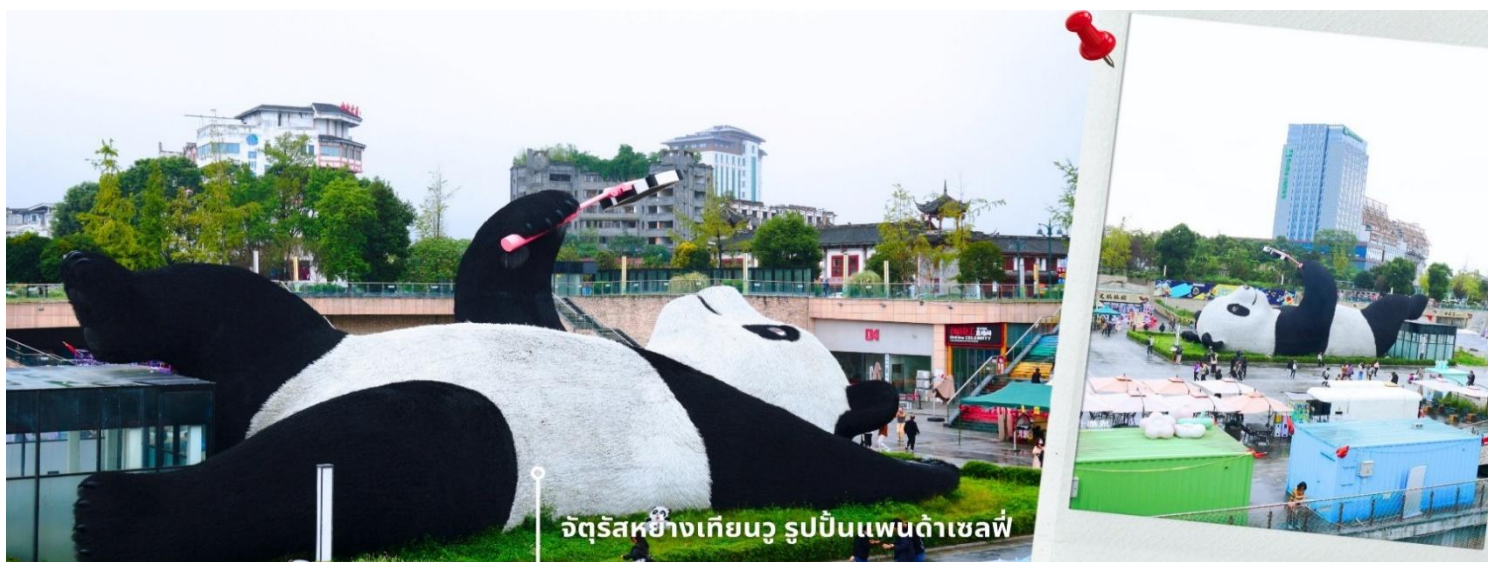
จัตุรัสหย่างเทียนวู รูปปั้นแพนด้าเซลฟี่

นำท่านเที่ยวชม จัตุรัสหย่างเทียนวู เป็นจุดเช็คอินที่สำคัญสำหรับคนที่มาเที่ยวที่ เมืองตูเจียงเยียน บริเวณจุดตัดท่าข้ามอำเภอตูเจียงเยียน นครเฉิงตู ไฮไลท์ของจัตุรัสหย่างเทียนวู คือ ประติมากรรม แพนด้ายักษ์ที่กำลังนอนหงายท้อง ยืนมีมือถือไม้เซลฟี่สีชมพู ซึ่งออกแบบโดยนักออกแบบชื่อดัง Florentijn Hofman รูปปั้นแพนด้า ยักษ์มีความยาว 26 เมตร กว้าง 11 เมตร สูง 12 เมตร และหนัก 130 ตัน แบบท่าทางสบายๆของแพนด้าที่ความประทับใจและรอยยิ้มให้กับผู้ที่มาเยือนจัตุรัสหย่างเทียนวู สามารถดึงดูดนักท่องเที่ยวได้เป็นจำนวนมากเลยทีเดียว เป็นการแสดงออกด้วยภาษาทางศิลปะแบบหนึ่งที่สะท้อนชีวิตในท้องถิ่น มอบความรู้สึกลึกลับสนทนสนมและมีความสุขกับผู้ชม อิสระเดินชมถ่ายภาพ รูปปั้นแพนด้าเซลฟี่ ตามอัยาศัย ที่นึ่งเป็นจุดเช็คอินที่เหมาะสมสำหรับทุกเพศทุกวัย หากคุณกำลังมองหาสถานที่ท่องเที่ยวใหม่ๆ ที่เต็มไปด้วย ความทรงจำดีๆ จตุรัสหย่างเทียนวอ คือคำตอบที่สมบูรณ์แบบ