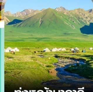
ทุ่งหญ้านาลาถิ