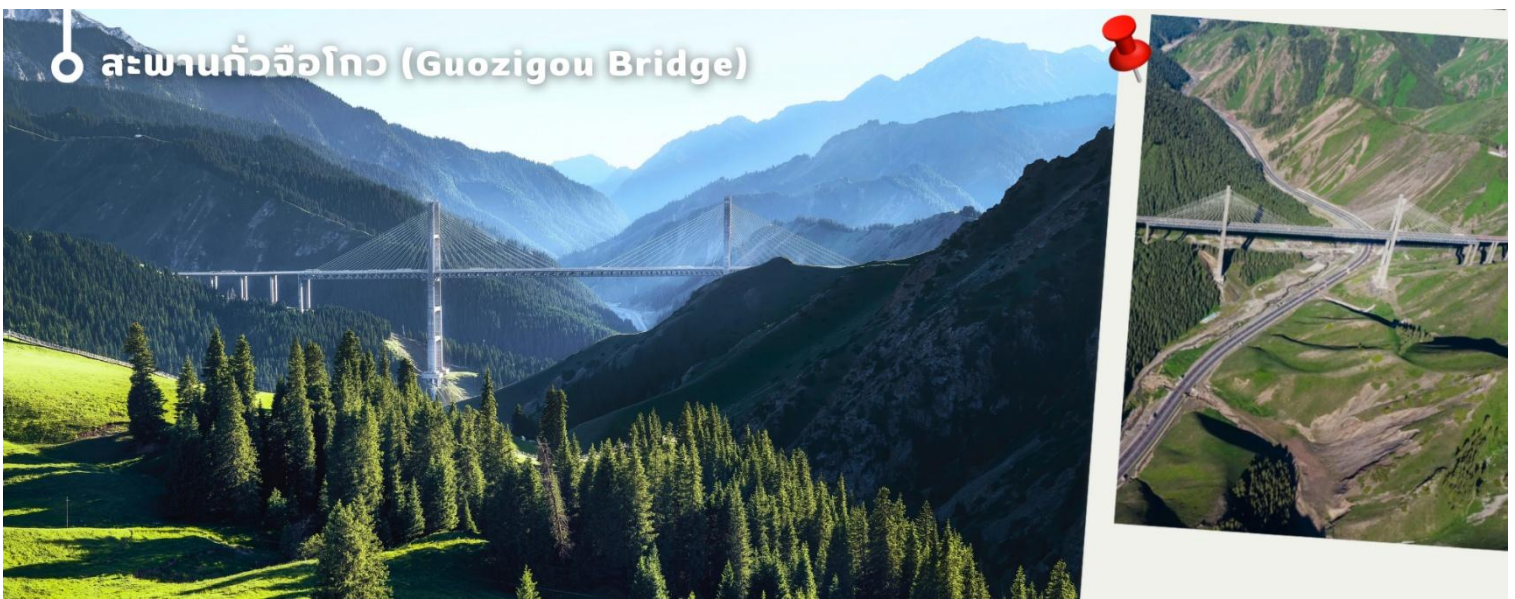
○ สะพานกัวจื่อโกว (Guozigou Bridge)

จากนั้นนำทุกท่านเดินทางไปยัง เมืองอีหนิง (Yining) เมืองหลวงของเขตปกครองตนเองอีลีคาซัค ในซินเจียง ทางตะวันตกเฉียงเหนือของจีน เป็นศูนย์กลางวัฒนธรรมที่มีความหลากหลายทางชาติพันธุ์ โดยเฉพาะชาวอุยกูร์และชาวคาซัค เมืองนี้มีชื่อเสียงด้านทิวทัศน์และธรรมชาติที่สวยงาม เช่น ทุ่งลาเวนเดอร์กว้างใหญ่ พร้อมเสน่ห์ของดนตรีพื้นเมืองและวิถีชีวิตท้องถิ่น อีกทั้งที่นี่ยังเป็นหนึ่งในจุดหมายสำคัญบนเส้นทางสายไหม ที่นักเดินทางทั่วโลกจะได้สัมผัสทั้งธรรมชาติและวัฒนธรรมในที่เดียว ระหว่างทางนำทุกท่าน ผ่านชม สะพานกัวจื่อโกว (Guozigou Bridge) สะพานขนาดใหญ่ที่ทอดข้ามหุบเขาในเขตซินเจียง หนึ่งในแลนด์มาร์คสำคัญบนเส้นทางสาย G30 ได้รับฉายาว่า “ประตูสู่เทือกเขาเทียนชาน” ระหว่างทางท่านจะได้ชมวิวสะพานที่ทอดยาวท่ามกลางภูเขาและหุบเขาอันงดงามตระการตา ใช้เวลาเดินทางโดยประมาณ 2.5 ชั่วโมง