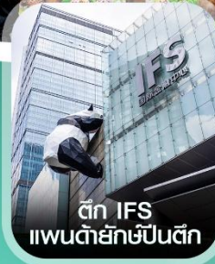
ตึก IFS แพนด้ายักษ์ป็นตึก