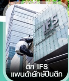
ตึก IFS แพนด้ายักษ์ป็นตึก