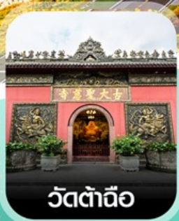
วัดต้าถิอ