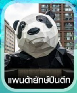
แพนด้ายักษ์ป็นตึก