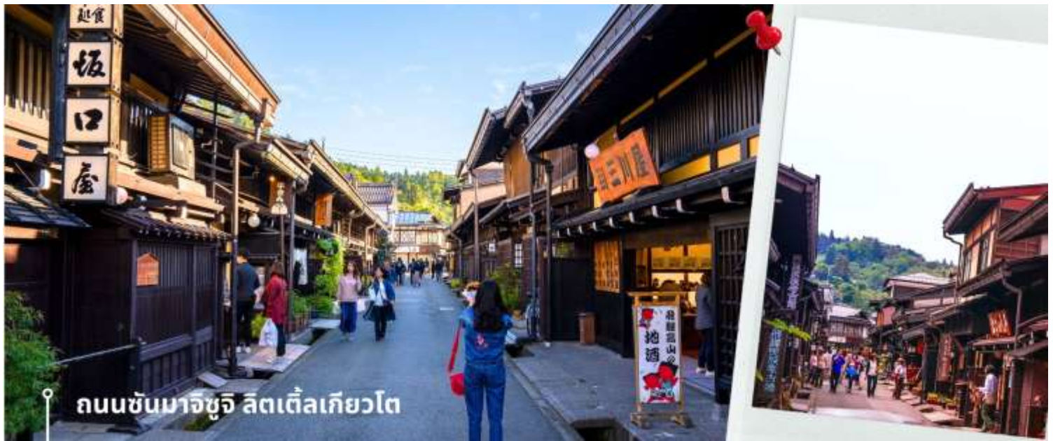
ถนนซันมาจิซุจิ ลิตเติ้ลเกียวโต

จากนั้นให้เวลาท่านเดินเล่นสัมผัสบรรยากาศกันต่อที่ ถนนซันมาจิซุจิ ซึ่งถูกขนานนามว่าเป็น “ลิตเติ้ลเกียวโต” บ้านไม้โบราณโทนสีน้ำตาลดำ เรียงรายไปตามทางเดิน มีคูน้ำอยู่รอบเมือง ปัจจุบันได้มีการปรับเปลี่ยนเป็นร้านค้า ร้านอาหาร ของที่ระลึก สำหรับนักท่องเที่ยวให้ได้เลือกชมทั้ง ผ้าแฮนด์เมด ชุดยูกาตะ ตึกดาซารุโอะโอะ