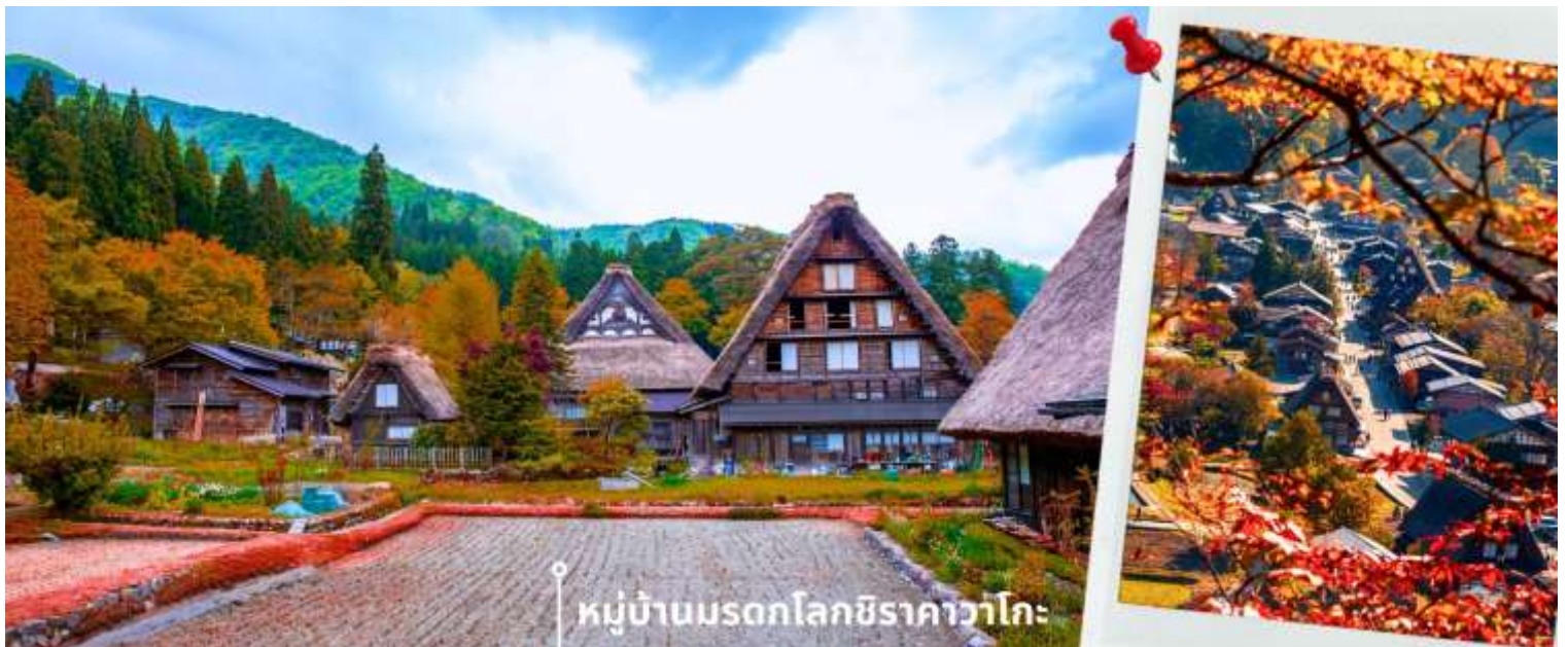
หมู่บ้านมรดกโลกชิราคาวาโกะ

จากนั้นนำท่านเดินทางสู่ เมืองกิฟุ พาท่านเข้าชม หมู่บ้านมรดกโลกชิราคาวาโกะ หมู่บ้านแห่งนี้ ตั้งอยู่ในหุบเขาสูงห่างไกลความเจริญ ทำให้ยังรักษาขนบธรรมเนียม ประเพณีอันดั้งเดิมไว้ได้อย่างสมบูรณ์ และเป็นหมู่บ้านที่มีรูปร่างแปลกตาติดอันดับ ซึ่งได้ชื่อว่าเป็น The most beautiful village in Japan โดยมีบ้านทรงแบบ “กัสโชสึคุริ” ซึ่งเป็นบ้านชาวนาโบราณที่มีอายุมากกว่า 250 ปี คำว่า กัสโช มีความหมายว่า พนมมือ ซึ่งคล้ายกับรูปแบบของบ้านที่มีหลังคามุงด้วยฟางข้าวที่ทำมุมชันถึง 60 องศา รวากับสองมือที่ประนมเข้าหากัน ตัวบ้านมีความยาวประมาณ 18 เมตร กว้าง 10 เมตร ทั้งหลังถูกสร้างขึ้นโดยไม่ใช้ตะปู ภายหลังจากในปี 1995 ได้รับการตั้งขึ้นเป็นมรดกโลก