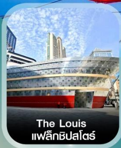
The Louis แมลลิคปลาซ่า