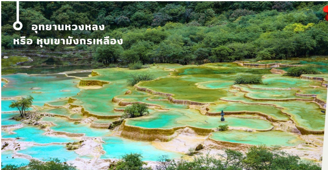
อุทยานหลวง หรือ หุบเขามังกรเหลือง