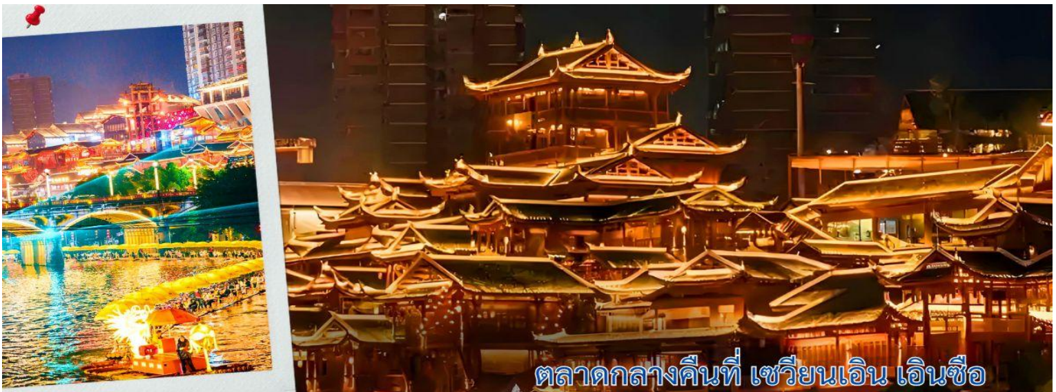
ตลาดกลางคืนที่ เซวียนเอน เอินซือ

จากนั้นนำทุกท่านเดินทางชมวิวกลางคืนเซวียนเอน วิวกลางคืนที่ เซวียนเอน (Xuan'en) มณฑลหูเป่ย์ โดดเด่นด้วยบรรยากาศเมืองโบราณที่ผสมผสานธรรมชาติกับวัฒนธรรม โดยเฉพาะการแสดงแสงสีเสียงริมน้ำที่ ถนนเก๋าชิงหลง และโถไล่อ่างการส่องเรือชมการแสดงน้ำพุเลเซอร์และจั่วเปลี่ยนหน้า นอกจากนี้ยังมีตลาดกลางคืน และกิจกรรมรอบกองไฟที่สะท้อนวัฒนธรรมชนเผ่าอู๋เจียไถ ทำให้เซวียนเอนเป็นจุดหมายที่สวยงามทั้งกลางวันและกลางคืน