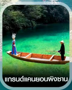
แกรนด์แคนยอนผิงชาน