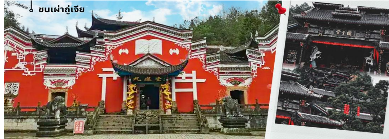
ชนเผ่าถู่เจีย

จากนั้นนำท่านเดินทางสู่ ชนเมืองชนเผ่าถู่เจียเอินซือ เป็นหนึ่งในกลุ่มชาติพันธุ์ที่มีจำนวนประชากรมากที่สุดในเขตนี้ จนทำให้อินซือได้ชื่อว่าเป็น “บ้านของชนเผ่าถู่เจีย” วัฒนธรรมของถู่เจียมีเอกลักษณ์ ทั้งด้านภาษา การแต่งกาย และประเพณีดั้งเดิม เช่น การรำมือ “ปายชั่ว” ซึ่งเป็นการเต้นรำหมู่ที่ใช้ท่ามือและท่าก้าวเท้าในการบอกเล่าเรื่องราว อีกทั้งยังมีเทศกาลเฉพาะของถู่เจีย เช่น เทศกาลปายชั่ว ที่จัดขึ้นเพื่อบูชาบรรพบุรุษและเฉลิมฉลองความเป็นชุมชนชนเผ่าถู่เจียในอินซือเป็นเสน่ห์สำคัญของการท่องเที่ยวเมืองนี้ เพราะนักท่องเที่ยวจะได้ทั้งชมภูมิทัศน์ที่สวยงาม และเรียนรู้วัฒนธรรมชาติพันธุ์ที่ยังคงรักษาขนบประเพณีดั้งเดิมไว้อย่างชัดเจน