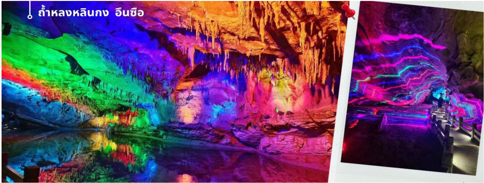
ถ้ำหลงหลินกง อินซือ

จากนั้นนำทุกท่านเดินทางสู่ จุดชมวิวพระราชวังเอินซือหลงหลิน หรือ ถ้ำหลงหลินกง หรือที่รู้จักกันทั่วไปในชื่อ "ถ้ำน้ำ" ตั้งอยู่ทางตะวันตกของเมืองเอินซือ มณฑลหูเป่ย์ ห่างจากใจกลางเมือง 8 กิโลเมตร เป็นถ้ำที่มีภูมิประเทศทางภูมิศาสตร์ ประกอบด้วยถ้ำน้ำ ถ้ำเขาวงกต และถ้ำแห้ง มีความยาวรวม 2,300 เมตร ภายในถ้ำมีจุดชมวิวมากกว่า 200 จุด ได้แก่ แท่นบูชาหนึ่งแท่น สองพระราชวัง สามผา เก้ามังกร สิบสามวิหาร และสมบัติยี่สิบแปดชิ้น ถ้ำแห่งนี้ยังคงรักษาความมหัศจรรย์ทางธรณีวิทยาเมื่อ 500 ล้านปีก่อนไว้ อากาศอบอุ่นในฤดูหนาวและเย็นสบายในฤดูร้อน อุณหภูมิเฉลี่ยต่อปีอยู่ที่ 20 องศาเซลเซียส ปัจจุบันเป็นแหล่งท่องเที่ยวระดับ AAA ระดับชาติ