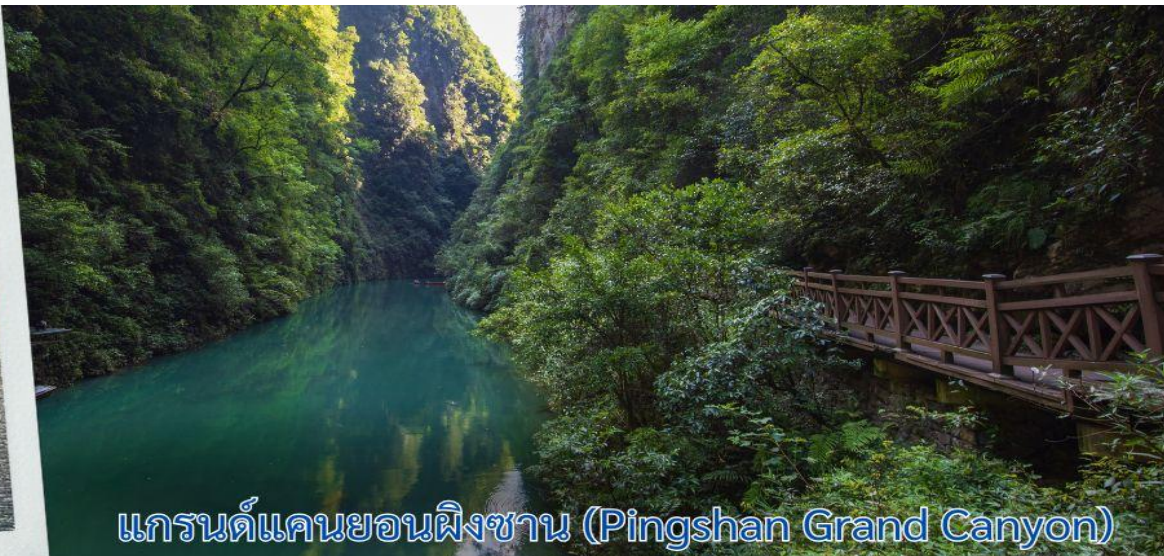
แกรนด์แคนยอนผิงซาน (Pingshan Grand Canyon)

เที่ยง รับประทานอาหารกลางวัน ณ ภัตตาคาร (6)