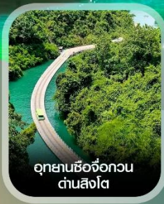
อุทยานซีจื่อกวน ด่านสิงโต