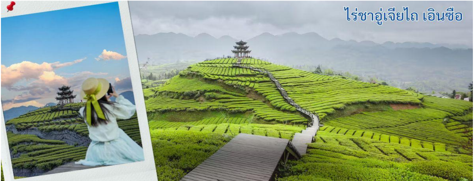
ไร่ชาอู๋เจียไถ เอินซือ

หลังจากรับประทานอาหารกลางวัน นำทุกท่านเดินชม ภูเขาใบชาอู๋เจียไถ คือแหล่งมรดกโลกที่ตั้งอยู่ในเขตภูเขา มณฑลชานซี ประเทศสาธารณรัฐประชาชนจีน เป็นหนึ่งในสี่ภูเขาอันศักดิ์สิทธิ์ทางพุทธศาสนาของจีน ณ ภูเขาอู๋ไถแห่งนี้เป็นที่ประทับของพระมัญชุศรีโพธิสัตว์ ธรรมราชากุมารในคติของพระพุทธศาสนาหายาน ได้รับการจัดระดับโดยคณะกรรมการจัดระดับคุณภาพสถานที่ท่องเที่ยวแห่งประเทศไทยในระดับ 5A เมื่อปี 2550 ภูเขาใบชาอู๋เจียไถ ตั้งอยู่ในเขตชานเอน มณฑลหูเป่ย์ ประเทศจีน เป็นแหล่งผลิตชาคุณภาพสูงที่มีชื่อเสียง โดยเฉพาะชา กังฉา ซึ่งเคยเป็นชาชั้นสูงที่ถวายแด่ฮ่องเต้ในอดีต แม้ว่าข้อมูลในวิกิพีเดียภาษาไทยจะเน้นไปที่เขาฝูถ้าว (ที่ประทับพระแม่กวนอิม) หรือเขาอู๋ไถ (หนึ่งในสี่ภูเขาศักดิ์สิทธิ์) แต่ อู๋เจียไถ เป็นที่รู้จักในฐานะไร่ชาที่มีทิวทัศน์สวยงามและผลิตชาชั้นดี มีการจำหน่ายและให้ชิมชาชาว ชาเขี้ยว และชาท้องถิ่น