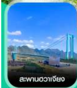
สะพานฮวาเจียง