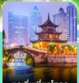
หอเจียเซี่ยวไหลว