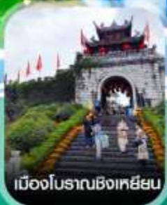
เมืองโบราณชิงเหยียน

คอนเฟิร์มออกเดินทาง ทุกพีเรียด 2 ท่านขึ้นไป