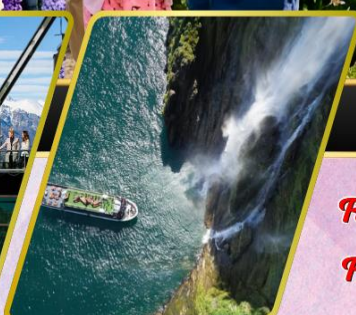
ล่องเรือมิลฟอร์ด ซาวน์