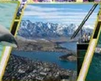
ชดเชาเมืองสีฟ้า