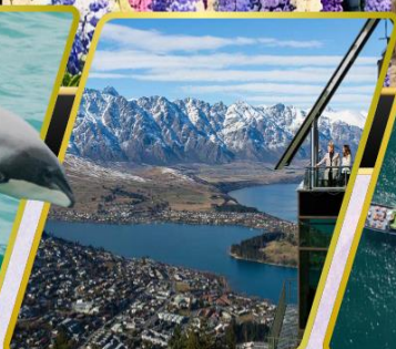
ยอดเขานีออนส์พีค