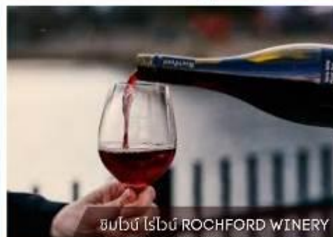
ชิมไวน์ ไวน์ ROCHFORD WINERY