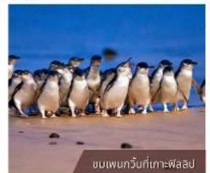
ชมเพนกวินที่เกาะฟิลลิป