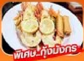
พิเศษ! กุ้งมังกร