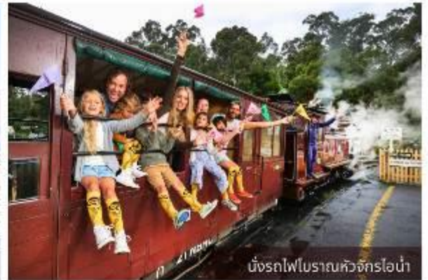
นั่งรถไฟโบราณหัวจักรไอน้ำ