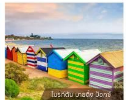
โบสถ์ต้น บาตัง นีอกซ์