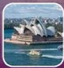
ชมเมืองซิดนีย์ในเช้าวันแรก