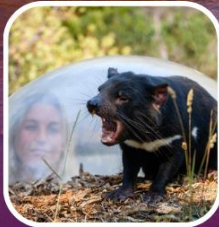
แทสเมเนียนเดวิล อันชู