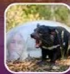
ชมสัตว์ป่าในเขตรักษาพันธุ์สัตว์ป่า