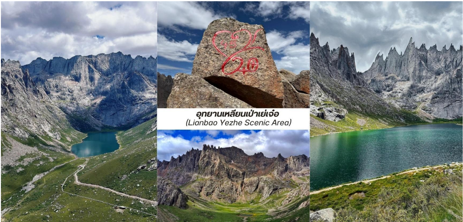
อุทยานเหลียนเป่าเย่เจ้อ (Lianbao Yezhe Scenic Area)

นำท่านเข้าชม อุทยานเหลียนเป่าเย่เจ้อ (Lianbao Yezhe Scenic Area) รวมค่าบริการรดน้ำเที่ยวภายในอุทยาน) ตั้งอยู่ในเขตที่ราบสูงอาปา มณฑลเสฉวน ประเทศจีนที่นี้คือขุมทรัพย์ทางธรรมชาติที่ยังคงความบริสุทธิ์ไว้อย่างสมบูรณ์เป็นสถานที่ท่องเที่ยวที่ได้ชื่อว่าเป็น “สวรรค์แห่งภูเขาและ ทะเลสาบ” ด้วยทิวทัศน์ อันยิ่งใหญ่และงดงาม หัวใจของเหลียนเป่าเย่เจ้อคือความอลังการของ ยอดเขาหิบนแกรนิต ที่มีรูปทรงแปลกตาและแหลมคมนับไม่ถ้วนมีความสลบซับซ้อน คล้ายกับป้อมปราการธรรมชาติ ยอดเขาสีเทาดำเหล่านี้ตั้งตระหง่าน อยู่ท่ามกลางผืนดินที่เขียวชอุ่มและรายล้อมด้วย ทะเลสาบสีมรกตและสีคราม ที่ใสราวกับกระจก ทะเลสาบแต่ละแห่งสะท้อนภาพของยอดเขาได้อย่างสมบูรณ์แบบราวกับเป็นภาพวาดในจินตนาการอย่างงดงาม