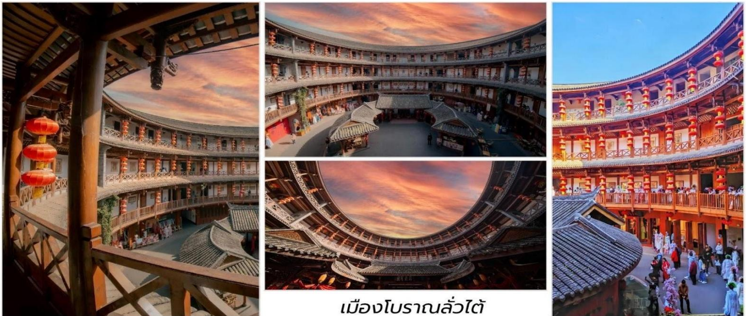
เมืองโบราณลั่วไต้

นำท่านชม เมืองโบราณลั่วไต้ เมืองนี้มีชื่อเสียงเป็นพิเศษในด้านการอนุรักษ์โบราณวัตถุ ทางวัฒนธรรมระดับชาติ ที่สำคัญพิพิธภัณฑ์อากาศและสวนอากาศ สถาปัตยกรรมจีนโบราณเป็นรูปแบบสถาปัตยกรรม ตามแบบฉบับของหมิงและชิงสลักด้วยรูปปั้นมังกร ฟีนิกซ์ ดอกไม้และนกอันน่าทึ่งมีรูปร่างเหมือนจริงและฝีมือประณีต