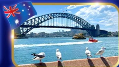
เขื่อนสะพานซิดนีย์ฮาร์เบอร์