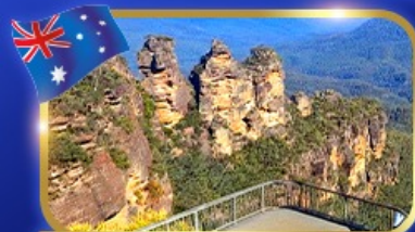
ชั้นชมวิวกีฬาซานลูมาเนอส์