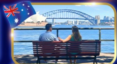
ชมวิวอ่าว สวนน้ำหินแบคควอรี