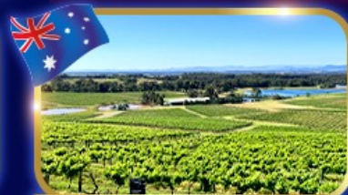
ชมไร่องุ่น โรมนบิว์ระดับโลก