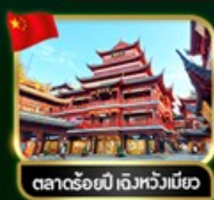
ตลาดร้อยปี เจิวหวงเมียว