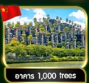
อาคาร 1,000 trees