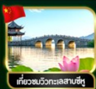
เที่ยวชมวิวทะเลสาบซีหู