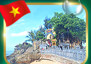
สักการะขอพรศาลเจ้าดิังกา