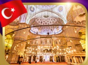
เข้าชมความงามสุเหร่าสีน้ำเงิน