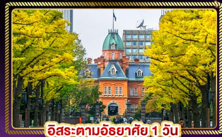
ฮิโรสะตามฮิโรสะ 1 วัน

น้ำหนักกระเป๋า 20 Kg. บริการอาหาร บนเครื่องบิน