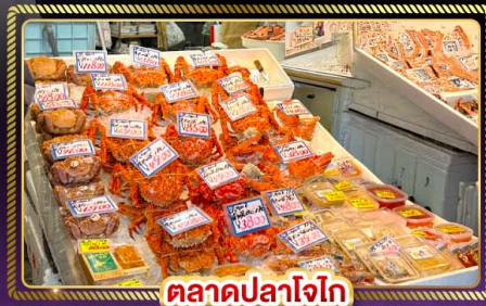
ตลาดปลาโอโตริ