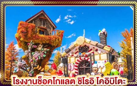
โรงงานช็อคโกแลต ชิโร โคอิโตะ