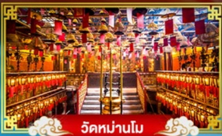
วัดหม่านโม

พักผ่อน "ริมฟ้ารุ่ง" บินรดลองเทศกาลปีใหม่ ณ เกาะฮ่องกง