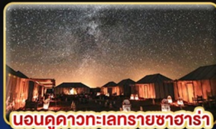
นอนดูดาวทะเลทรายซาฮารา