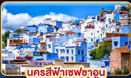
นครสีฟ้าเซฟซาอูน

📅 เดินทาง: 19-28 ต.ค. | 05-14 ส.ค. 69 30 ส.ค. 69-08 ม.ค. 70