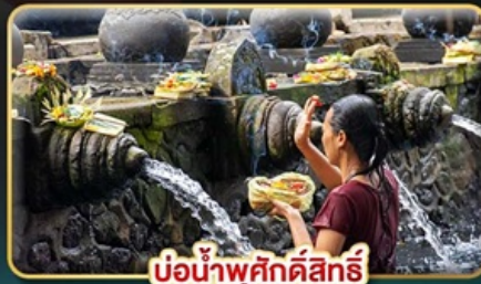
บ่อน้ำพุศักดิ์สิทธิ์