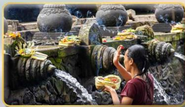
วัดน้ำพุศักดิ์สิทธิ์