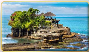
วิหารทานาห์ลอต