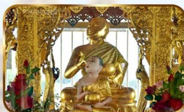
ขอพระอุปกุต ปางจกบาตรเยี่ยมมาร