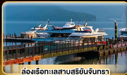
ล่องเรือทะเลสาบสุริยจันทร