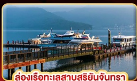
ล่องเรือทะเลสาบสุริยจันทร์

บินเต็ม STREET FOOD แบบจุใจ ขอความรักวัดแดงซาน