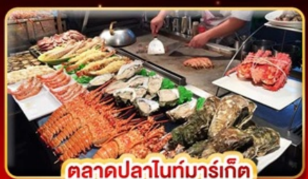
ตลาดปลาไนท์มาร์เก็ต