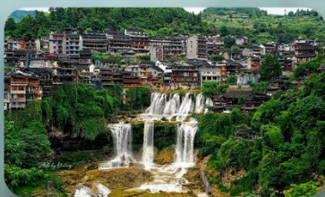
หมู่บ้านฟุหลงเจิ้น