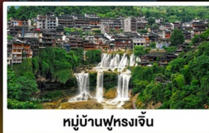
หมู่บ้านฟุทงเจิ้น