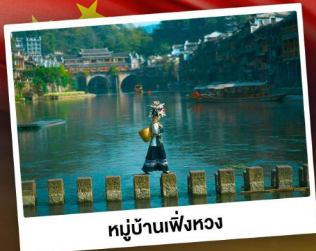
หมู่บ้านเฟิงหวง