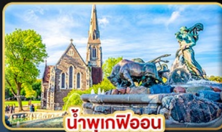
น้ำพุเทพีออน