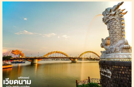
เวียดนาม ดานัง • โฮอัน • บาน่าฮิลล์

จากนั้น นำท่านชม สะพานมังกร Dragon Bridge อีกหนึ่งทีเี่ยวดานังแห่งใหม่สะพานมังกรไฟสัญลักษณ์ความสำเร็จแห่งใหม่ของเวียดนาม ที่มีความยาว 666 เมตร ความกว้างเท่าถนน 6 เลนส์ เชื่อมต่อสองฟากฝั่งของแม่น้ำฮันประเทศเวียดนามสะพานมังกรถูกสร้างขึ้นเพื่อเป็นแหล่งท่องเที่ยวดานัง เป็นสัญลักษณ์ของการฟื้นคืนประเทศ และเป็นการฟื้นฟูเศรษฐกิจของประเทศ โดยได้เปิดใช้งานตั้งแต่ปี 2013 ด้วยสถาปัตยกรรมที่บวักกับเทคโนโลยีสมัยใหม่ที่ได้รับแรงบันดาลใจจากตำนานของเวียดนามเมื่อกว่าหนึ่งพันปีมาแล้ว