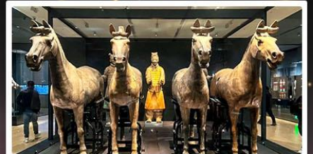
สุสานทหารจิ้นซี