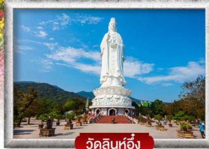
วัดลินห์ฮ้าง