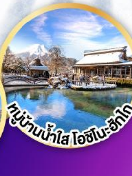
หมู่บ้านน้ำใส ไอชิโนะ-ซึกาโ